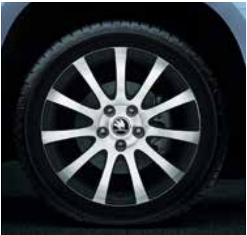
Kolo z lehké slitiny Annapurna 7,0J x 17" pro pneumatiky 225/50 R17, v šedé antracitové barvě (5L0 071 497E HA7)