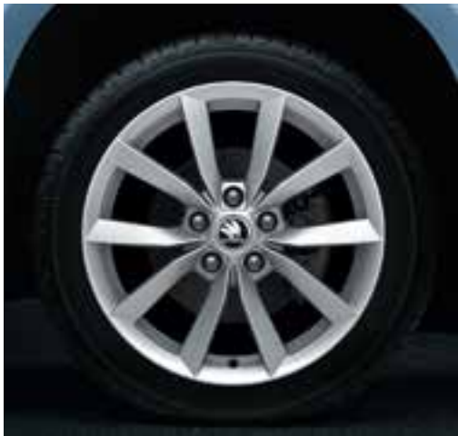
Kolo z lehké slitiny Scudo 7,0J x 17" pro pneumatiky 225/50 R17, ve stříbrné barvě (5L0 071 497M 8Z8)