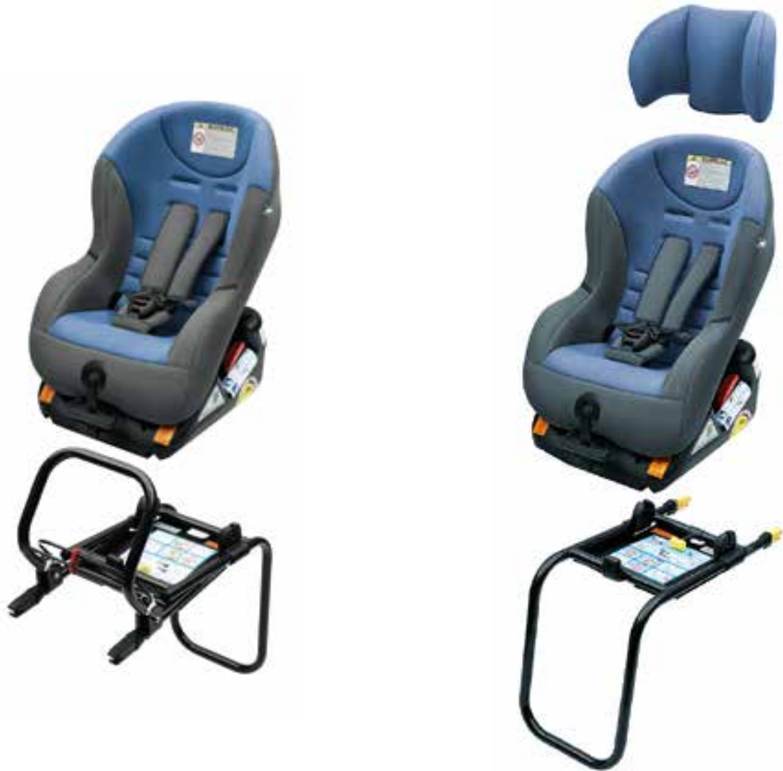
Dětská autosedačka ISOFIX G 0/1 (5LO 019 905); rám RWF pro upevnění proti směru jízdy (DDF 000 003A); rám FWF pro upevnění po směru jízdy (5LO 019 902); hlavová opěrka (5LO 019 903)