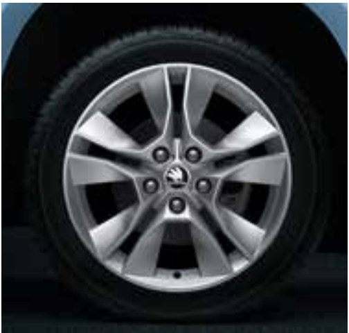
Kolo z lehké slitiny Blossom 7,0J x 17" pro pneumatiky 225/50 R17, ve stříbrné barvě (5L0 071 497A 8Z8)