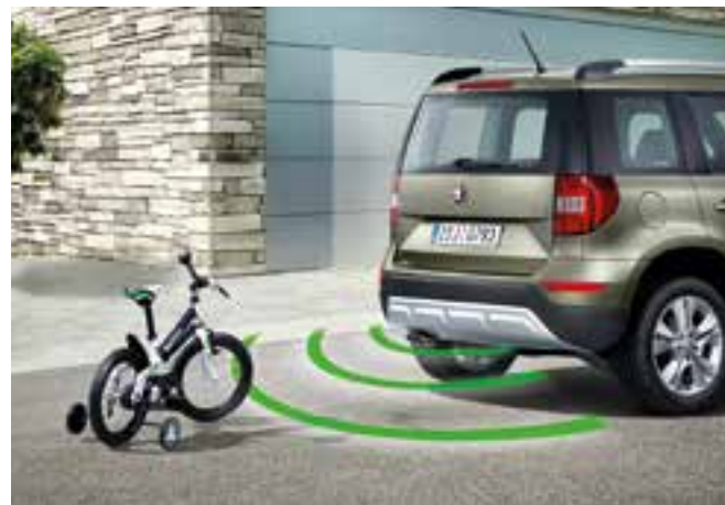
Zadní parkovací senzory hlídají vzdálenost vozu od případné překážky. Objeví-li se překážka ve vzdálenosti 140 cm od zadní části vozu, je signalizována krátkými pípnutími v intervalu 1 sekundy. Tento interval se plynule zkracuje s přibližováním se k překážce. Při přiblížení na 30 cm přejde pípání v souvislý tón (BKA 600 003A)