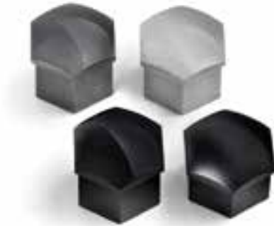
Krytky šroubů* pro estetičtější vzhled kol; stříbrnošedá matná (1Z0 071 215 Z37); pro kola s bezpečnostními šrouby 000 071 597 C (1Z0 071 215A Z37); stříbrnošedá lesklá (1Z0 071 215 U27); stříbrná metal (1Z0 071 215 7ZS); černá lesk (1Z0 071 215 9B9); černá mat (1Z0 071 215 01C); pro kola s bezpečnostními šrouby 000 071 597 C (1Z0 071 215A 01C)