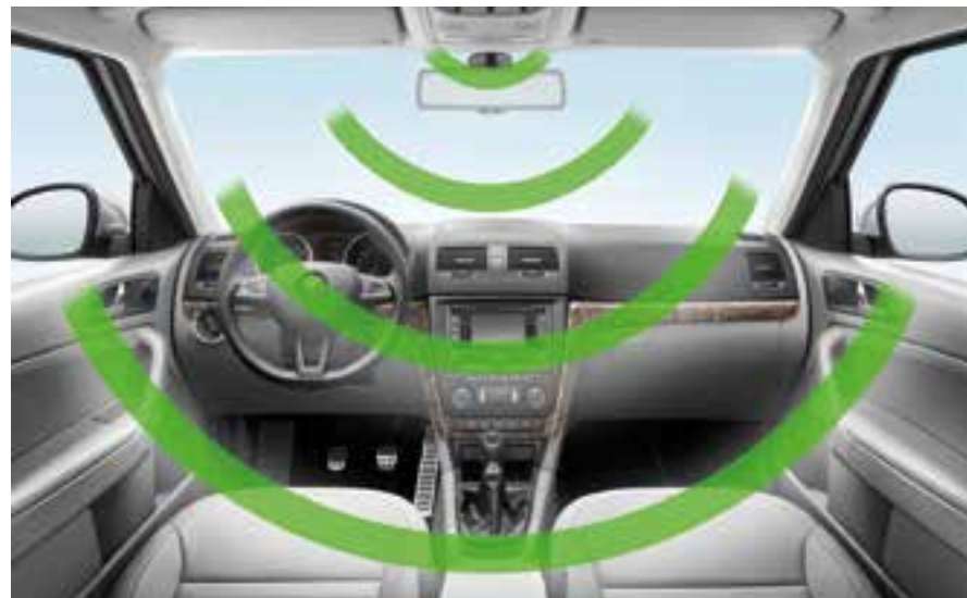
Alarm s hlídáním vnitřního prostoru je vybaven zálohovým zdrojem, který zajistí funkčnost systému i po odpojení baterie. Aktivuje se automaticky po uzamčení vozu a monitoruje všechny dveře, víko motoru, spínací skříňku a vnitřní prostor vozidla. Jestliže dojde k nedovolenému zásahu, uvede řídicí jednotka v činnost všechna směrová světla a sirénu. Zvukový alarm trvá 25 vteřin a může být vyvolán opakovaně až 10x za sebou. Základní sada alarmu pro vozy se sériovým dálkovým ovládáním centrálního zamykání (BKA 700 001); základní sada alarmu pro vozy bez dálkového ovládání centrálního zamykání (BKA 700 002); montážní sada pro alarm (BKA 630 001)