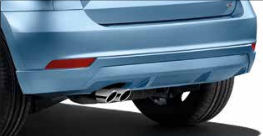
Spoiler zadního nárazníku V kombinaci s předním spoilerem může naplnit sportovní ambice vozu Yeti (5L6 071 610 pro vozy bez přípravy pro tažné zařízení; pro vozy s přípravou pro tažné zařízení 5L6 071 610A)