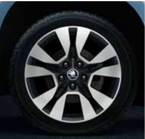
Kolo z lehké slitiny Origami 7,0J x 17" pro pneumatiky 225/50 R17, v černé lesklé barvě (5L0 071 497K FL8)