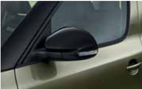
Kryty bočních zrcátek v černém designu Kryty bočních zrcátek v designovém provedení černá metalická (5L0 072 530)