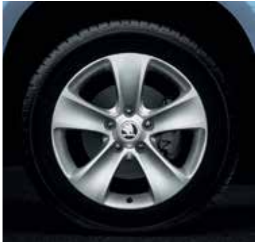
Kolo z lehké slitiny Moon 7,0J x 16" pro pneumatiky 205/55 R16, ve stříbrné barvě (3T0 071 496A 7ZS)