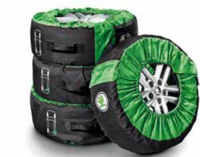
Obal na kompletní kola Komfortní sada obalů na kola do 18" a 245 mm šířky. Je vyrobena z kvalitního polyesteru a díky robustním držadlům umožňuje snadný transport a přenášení kol (000 073 900B)