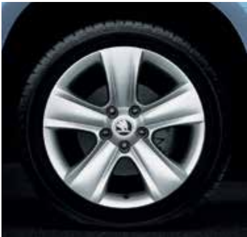
Kolo z lehké slitiny Dolomite 7,0J x 17" pro pneumatiky 225/50 R17, ve stříbrné barvě (5L0 071 497G 7ZS)