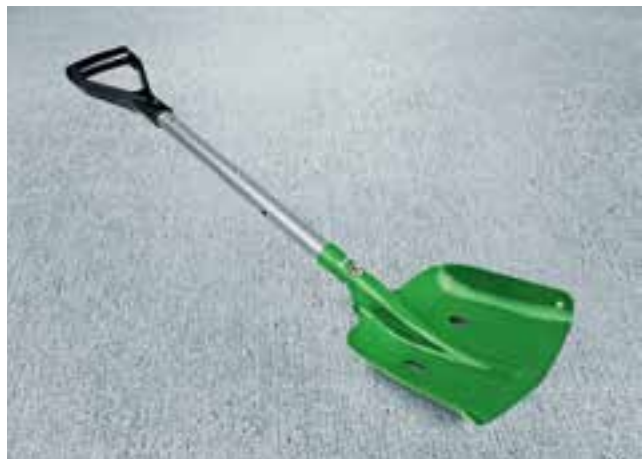
Skládací lopata na sníh vyrobená z hliníkové slitiny, hmotnost 750 g, třídlílná, včetně praktického textilního obalu (5L0 099 320)