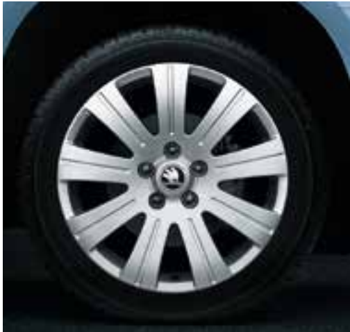
Kolo z lehké slitiny Flash 6,0J x 17" pro pneumatiky 205/50 R17, ve stříbrné barvě (5E0 071 497B 7ZS)