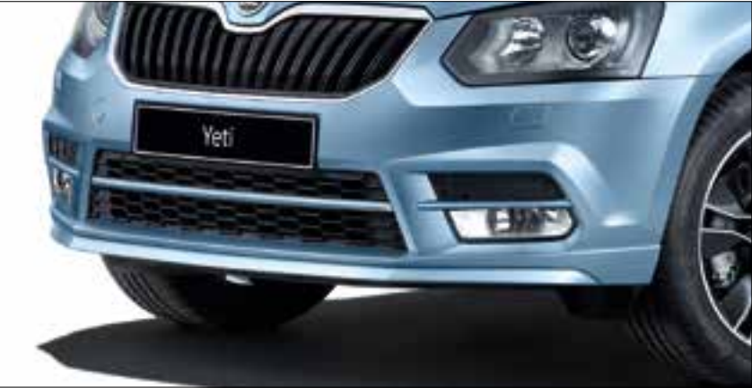
Spoiler předního nárazníku pro sportovnější vzhled přední části vozu (5L0 071 609)