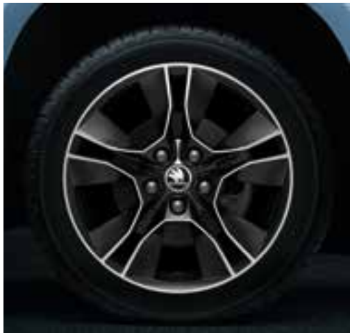
Kolo z lehké slitiny Blossom 7,0J x 17" pro pneumatiky 225/50 R17, v černé lesklé barvě (5L0 071 497A JX2)