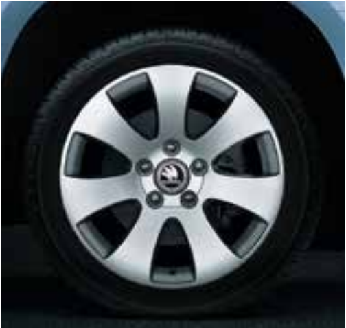
Kolo z lehké slitiny Spectrum 7,0J x 16" pro pneumatiky 205/55 R16, ve stříbrné barvě (3T0 071 496 7ZS)