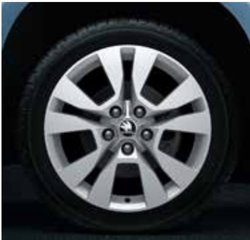
Kolo z lehké slitiny Origami 7,0J x 17" pro pneumatiky 225/50 R17, ve stříbrné barvě (5L0 071 497L 8Z8)