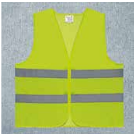
Lehká reflexní výstražná vesta ve fluorescenční žluté barvě ze 100% polyesteru v textilním pouzdře. Důležitá součást bezpečnostní výbavy vozu (3T0 093 056); v nabídce též v oranžové barvě (XXA 009 001)