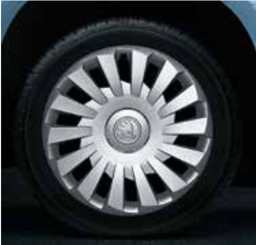
Velkoplošné kryty Nordic pro kola 6,0J x 16", čtyřdílná sada (5E0 071 456)