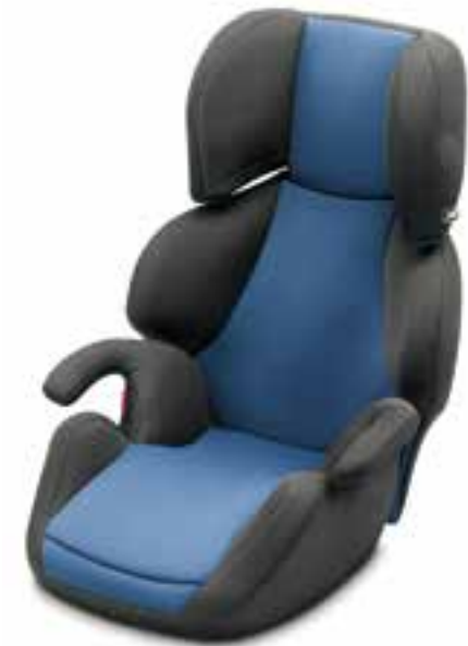
Dětská autosedačka Wavo 1-2-3 (5LO 019 900B)