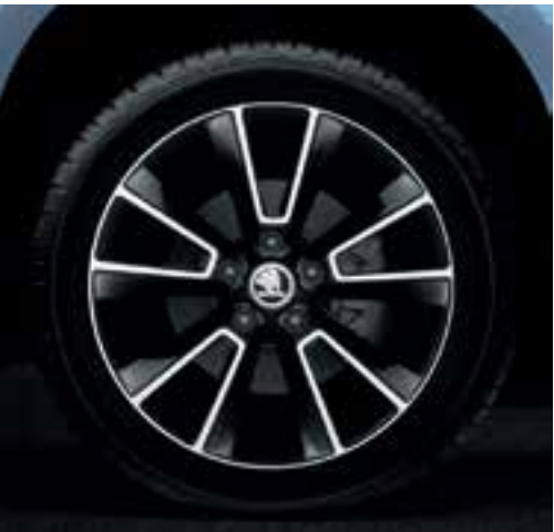
Kolo z lehké slitiny Matterhorn 7,0J x 17" pro pneumatiky 225/50 R17, v černé lesklé barvě (5L0 071 497H FL8)