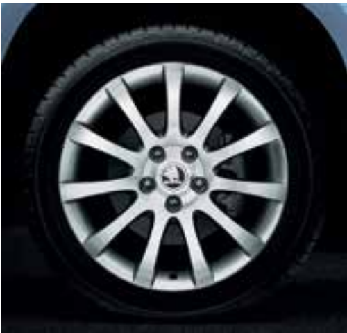
Kolo z lehké slitiny Annapurna 7,0J x 17" pro pneumatiky 225/50 R17, ve stříbrné barvě (5L0 071 497C 7ZS)