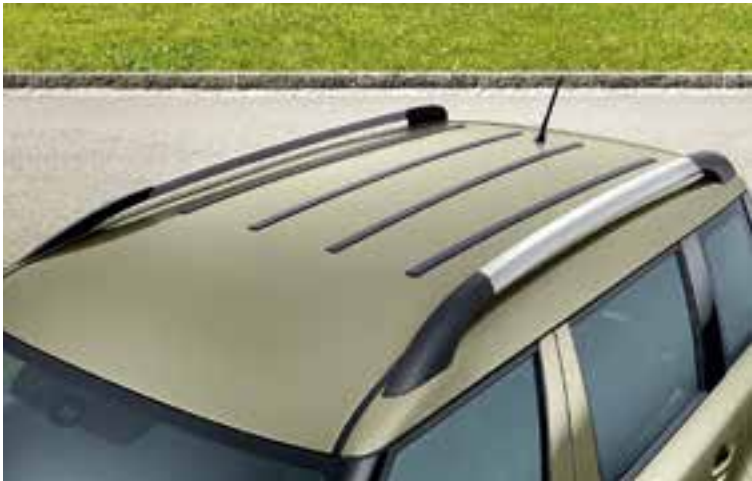
Střešní lišty Plastové střešní lišty ochrání střechu vozu před poškozením při manipulaci s předměty převáženými na střešním nosiči. Čtyřdílná sada černých lišt je vyrobena z materiálu ABS/ASA a upevňuje se na karoserii pomocí speciálního tmelu (5L0 071 326)