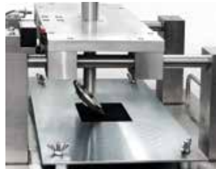
Přístroj na provádění podpatkového testu Testování pevnosti fixačních elementů

Čtyřdílné sady; pro levostranné řízení (5L1 061 550A); pro pravostranné řízení (5L2 061 550A)