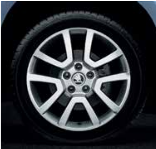
Kolo z lehké slitiny Spitzberg 7,0J x 17" pro pneumatiky 225/50 R17, ve stříbrné barvě (5L0 071 497F 7ZS)