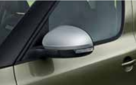
Kryty bočních zrcátek v hliníkovém designu Při pořízování vozu Yeti se můžete rozhodnout pro jeden ze tří vzhledů krytů vnějších zpětných zrcátek. Základní černou variantu lze vyměnit za kryty v barvě karoserie nebo ve stříbrné barvě se vzhledem hliníku. Stříbrná zrcátka jsou již sériovou součástí modelu Yeti Outdoor (5L0 071 719)