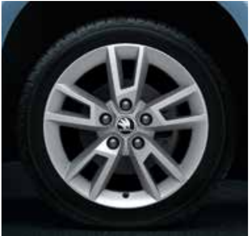
Kolo z lehké slitiny Forrest 7,0J x 16" pro pneumatiky 205/55 R16, ve stříbrné barvě (5L0 071 496B 8Z8)