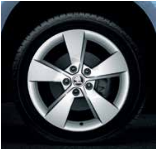
Kolo z lehké slitiny Erebus 7,0J x 17" pro pneumatiky 225/50 R17, ve stříbrné barvě (5L0 071 497J 8Z8)