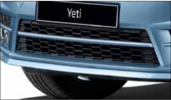
Dekorativní lišta předního nárazníku Lišta lakovaná v barvě vozu pro stylový vzhled masky vozu (5L0 071 004A)