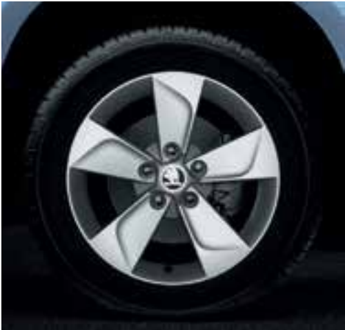
Kolo z lehké slitiny Nevis 7,0J x 16" pro pneumatiky 205/55 R16, ve stříbrné barvě (5L0 071 496A 8Z8)