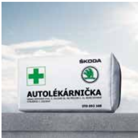
Autolékárníčka s obsahem odpovídajícím novelizované vyhlášce č. 216/2010 (3T0 093 108)