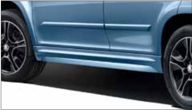
Boční kryty prahů Robustní kryty prahů pro dynamičtější vzhled vašeho vozu Yeti (5L0 071 685A)