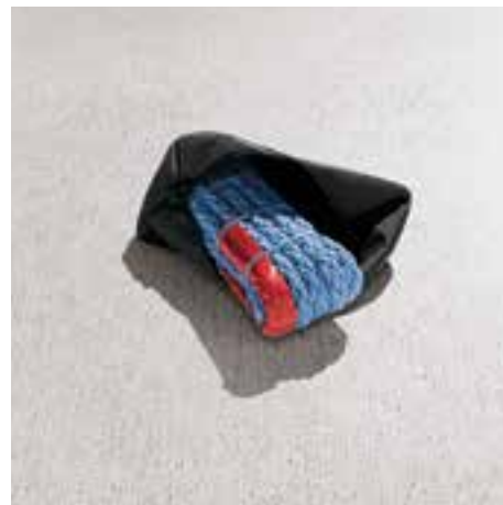
Atestované tažné lano umožňující táhnout vozidla o celkové hmotnosti až 2 500 kg (GAA 500 001)